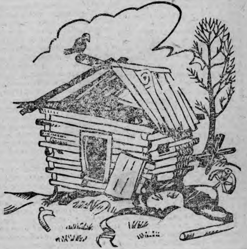
По стану похода немножко, Сказал бы Пушкин наш, ей, ей: — Избушка там на курьих ножках Стоит без окон, без дверей. (Журнал „Колхозный бригадир“)