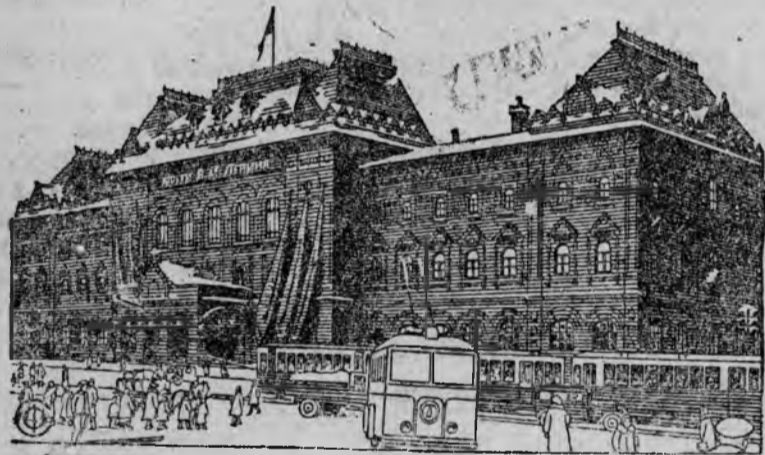
На снимке: здание музея В.И. ЛЕНИНА на площади Революции в Москве.