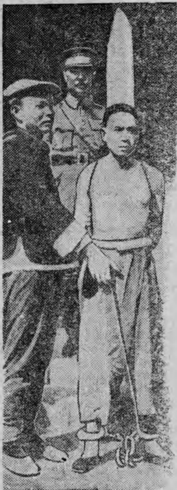
НА СНИМКЕ: уличная сцена в Китае: приговоренного к смертной казни партизана проводят по улицам города скованного и с доской за спиной, на которой перечислены „преступления“. (Из швейцарского журнала „Швейцар Иллюстрирте“).

Китайские власти присуждают красных партизан к смертной казни